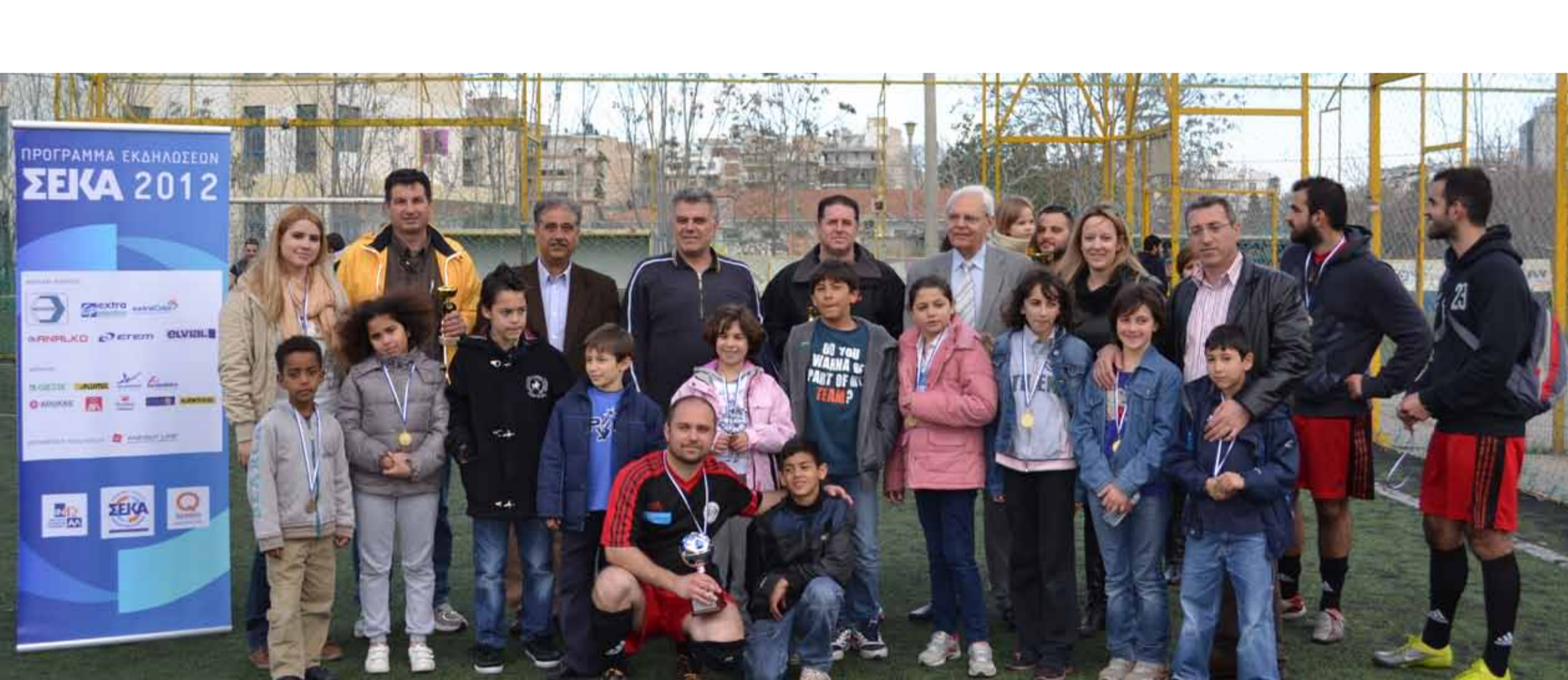
Αναμνηστική φωτογραφία των παιδιών και των εκπροσώπων από τα Παιδικά Χωριά SOS με τους νικητές και τους παράγοντες του ΣΕΚΑ

Η μεγάλη συμμετοχή και οι δυνατές αναμετρήσεις κράτησαν αμείωτο το ενδιαφέρον καθ' όλη τη διάρκεια των 2 μηνών που διήρκεσαν οι αγώνες. Τα έσοδα που συγκεντρώθηκαν δόθηκαν για την ενίσχυση των Παιδικών Χωριών SOS Βάρης .