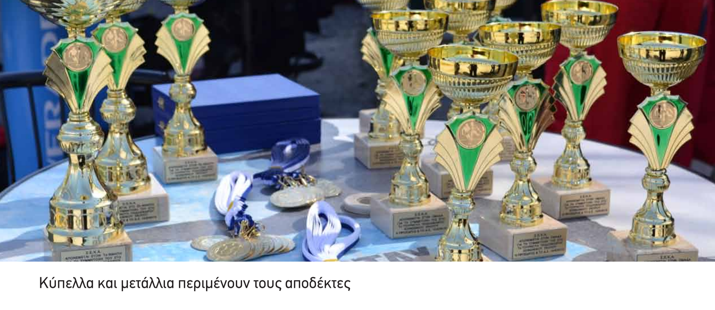
Κύπελλα και μετάλλια περιμένουν τους αποδέκτες

Έπεσε η αυλαία του 1ου τουρνουά ποδοσφαίρου 5X5 φιλανθρωπικού σκοπού που διοργάνωσε ο ΣΕΚΑ. Ήταν μια γιορτή εθελοντισμού και κοινωνικής ευαισθησίας, με την ομάδα της Επιτροπής Νέων να κερδίζει στον τελικό την ΑΛΚΑΤ – Δαμανάκης . Τρίτη τερμάτισε η ομάδα της FENESTRAL που επικράτησε στο μικρό τελικό των Ασυγκράτητων .