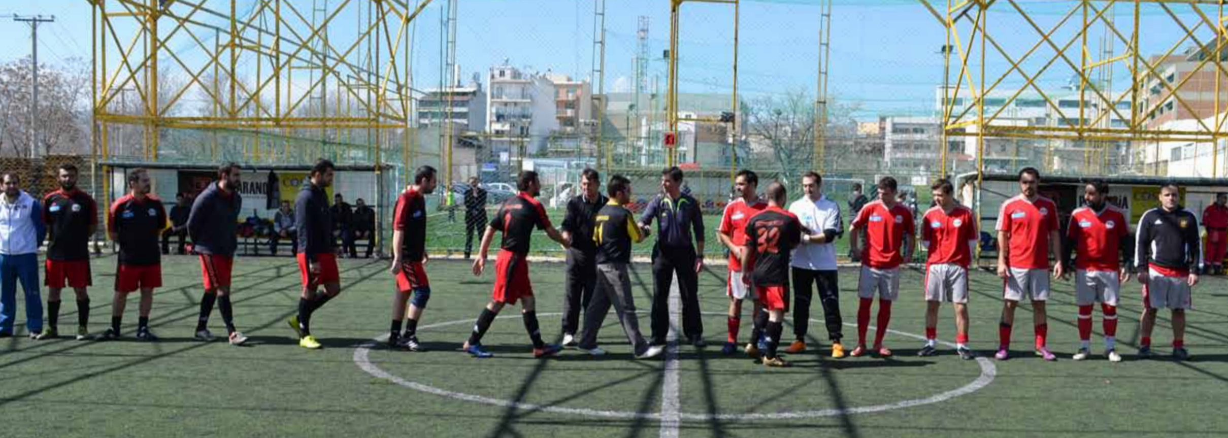
Συναδελφικός χαιρετισμός ανάμεσα στους δύο φιναλίστ